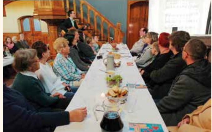
Tischabendmahl zu Gründonnerstag