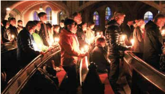
Osternacht in der Brüderkirche