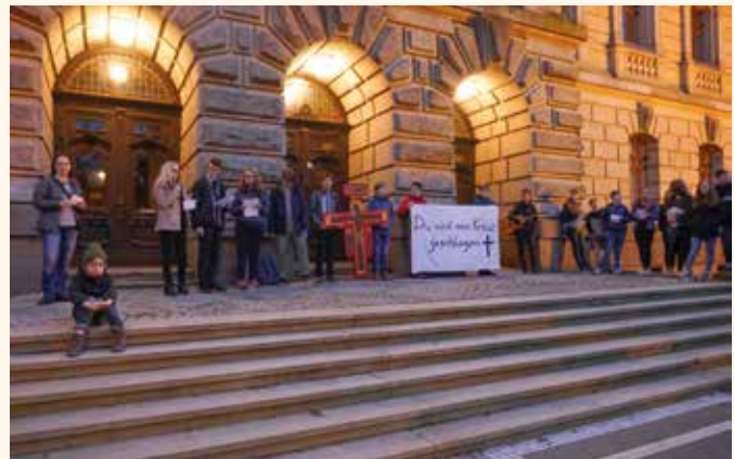
Kreuzweg der Jugend