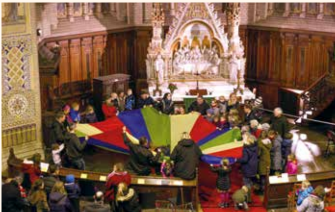
Gottesdienst mit Kleinen