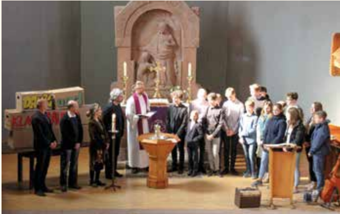
Vorstellungsgottesdienst der Konfirmanden