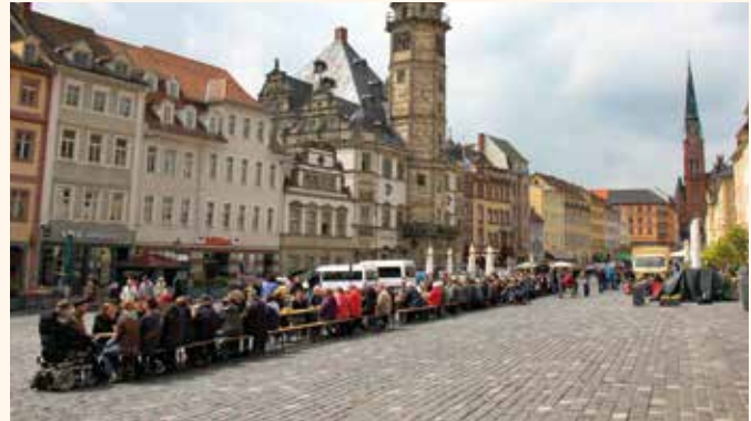
Altenburger essen gemeinsam